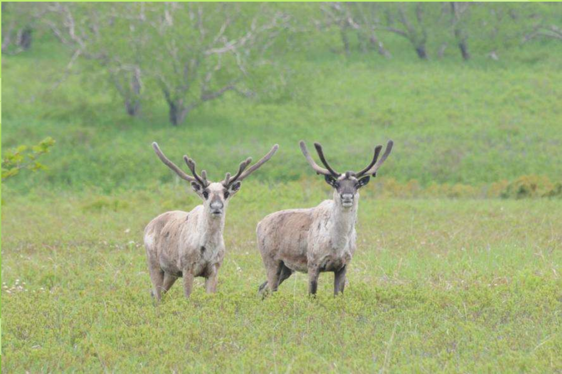
Дикий северный олень