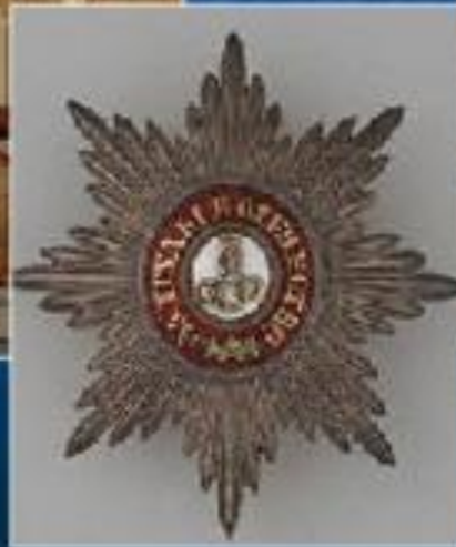
Орден св. Александра Невского