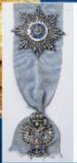
Орден св. Андрея Первозванного