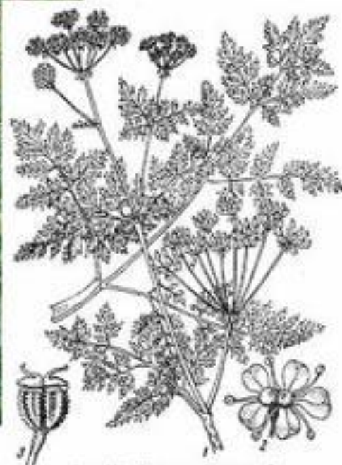
Рис. 223. Болиголов пятнистый. 1 — стебель, 2 — цветок, 3 — плод.